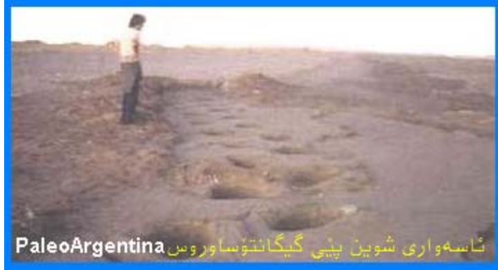
ناسه واری شوین پپی گیگانتوساوروس PaleArgentina

گیگانتوساوروس گیانداریک بووه که له سهر دوو قاچان راوه ستاوه و پویشتووه و رای کردووه. به پپی لیکولینه وه و خویندنه وه ی شوین پپی نه و دایناسوره، ده رکه وتووه که گیانداریکی چابوک و چالاک بووه له راکردن دا.