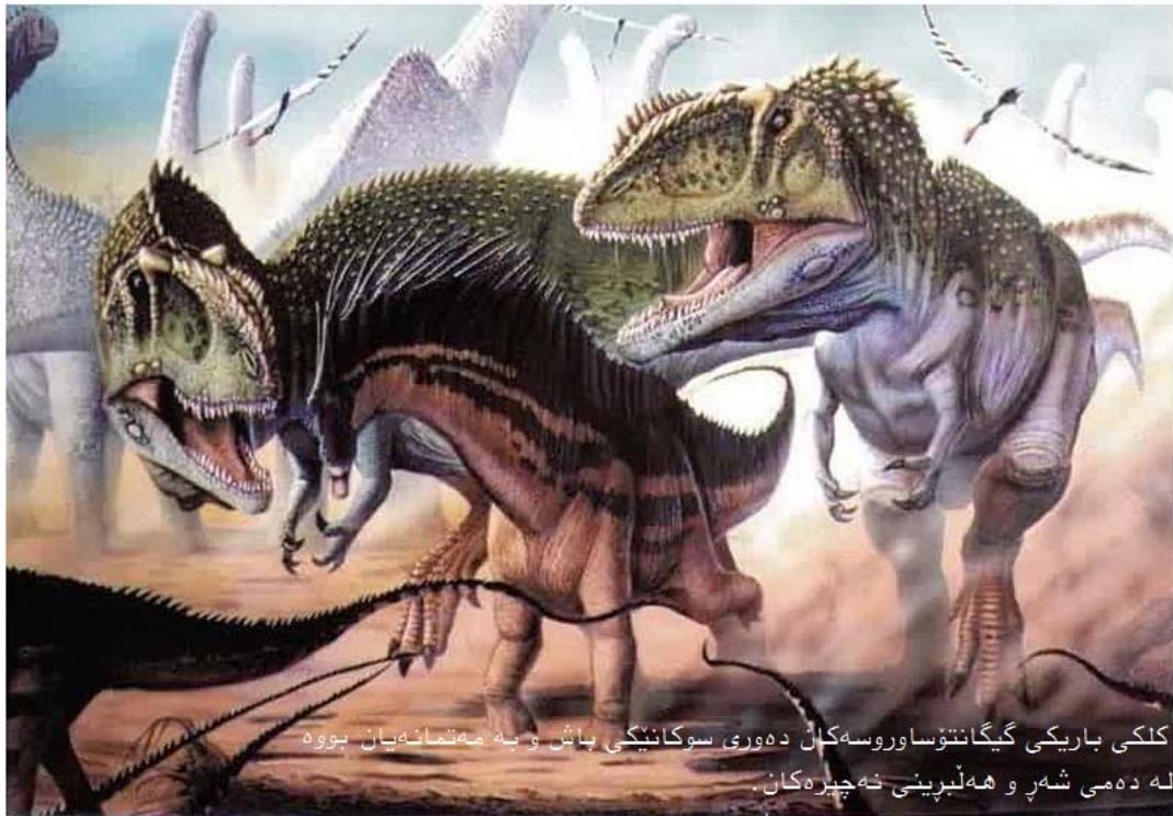
کلکی باریکی گیگانتوساوروسه کان ده وری سوکانیکی باش و به ماتمانه یان بووه له ده می شه ر و هه لبرینی نه چیره کان.

کلکی باریکی گیگانتوساوروس له ده می شوین هه لگرتنی نه چیره کانی دا ده وری سوکانیکی باش و به ماتمانه ی هه بووه له راکردن و وه رچه رخانه وه ی کوتوپیری دا.