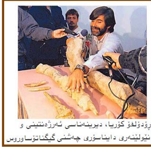
رۆدۆلفۆ کوریا، دیرینەناسی ئەرزەنتینی و نیۆلینەری دایناسۆری چەشنی گیگانتۆساوروس

سالی 1994 ی زایینی (رۆبین کارۆلینی)، پیشەوہریکی بەشی میکانیکی ئەرزەنتینی ، بۆ یەکەمجار فۆسیلی ئەو چەشنە دایناسۆرە دۆزییەوہ .دوای ئەو سالی ش کەسیک بە ناوی رۆدۆلفۆ کوریا (Rodolfo Coria)، دیرینەناسی مۆزەخانە ی کارمەن فۆنس لە